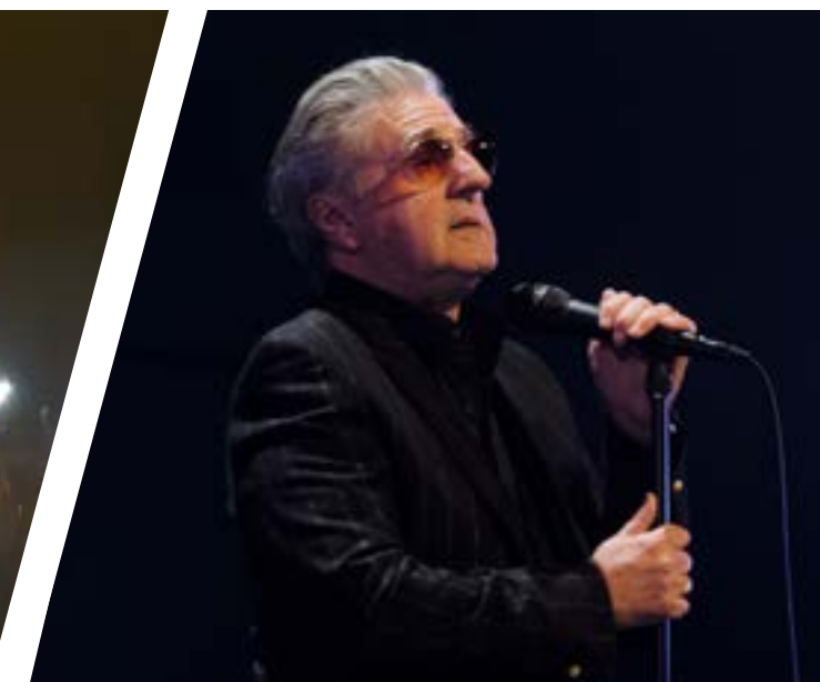
Daniel Auteuil