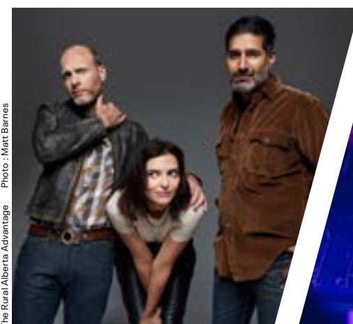
The Rural Alberta Advantage