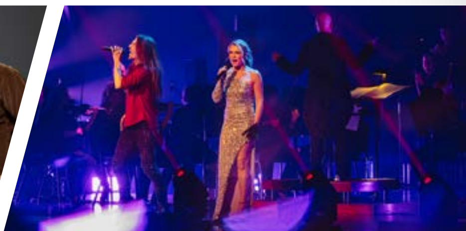
Queen Symphonic