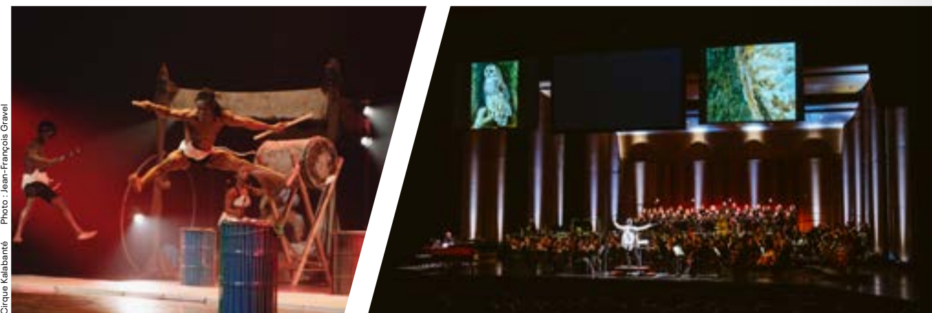
Cirque Kalabanté

Le comité d'audit est composé de trois membres indépendants nommés par le conseil d'administration. Son rôle consiste à seconder le conseil en matière de reddition de comptes et d'intégrité de l'information financière et des états financiers. Il doit s'assurer également de la mise en place de mécanismes de contrôle interne.