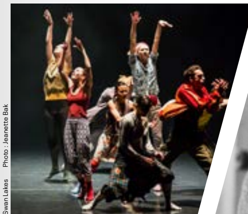
Sven Lakes Photo : Jeannette Bak