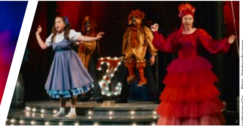
Le Magicien d'Oz