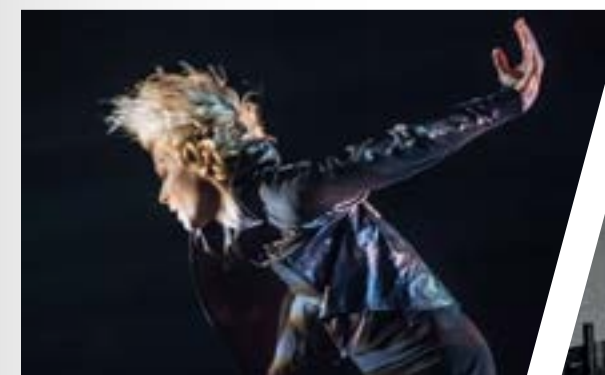
Louise Lecavalier