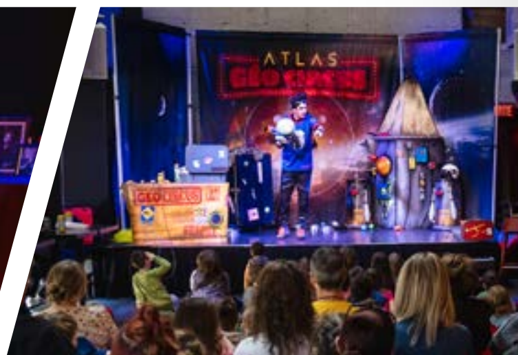
Atlas Géocircus