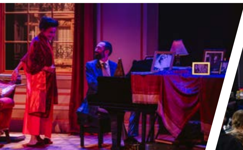
Maria Callas - Une voix pour être aimée