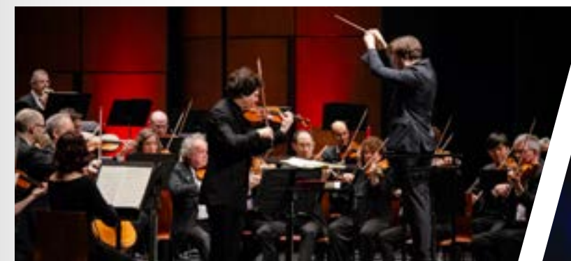
Orchestre symphonique de Québec - Hadelich joue Brahms