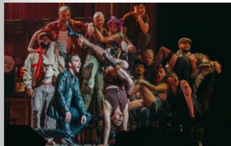
Pub Royal