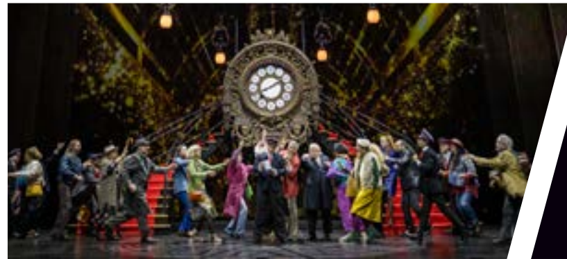
Festival d'Opéra de Québec - La vie parisienne

Centre de la francophonie des Amériques La Rotonde Centre d'études collégiales de Montmagny La Tribu Centre R.I.R.E. 2000 Le Phoque OFF Concerts pour toutes les oreilles Les Escales en chanson de Petite-Vallée Conservatoire de musique de Québec Maison pour la danse De la Létourneau Musée de la civilisation Festival d'été de Québec Nuits d'Afrique Festival Québec Jazz en Juin Rideau Hublo Solotech KWE! À la rencontre des peuples autochtones Unidsounds L'Ampli de Québec Ville de Québec