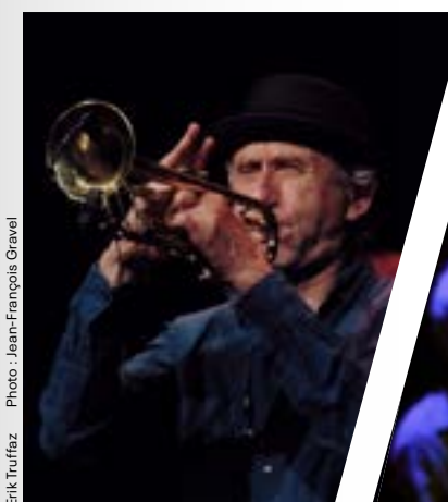
Erik Truffaz