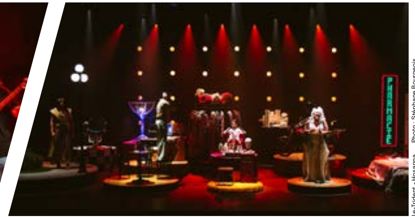
Le Tridant - Hosanna