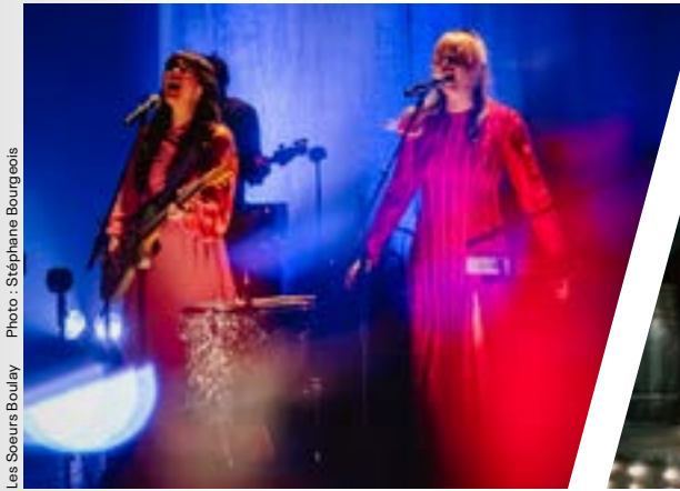
Les Sœurs Boulay