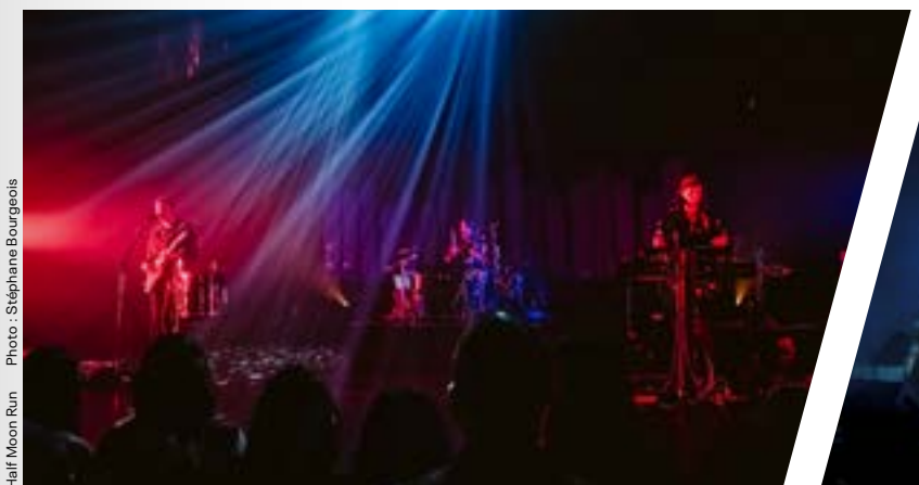
Half Moon Run