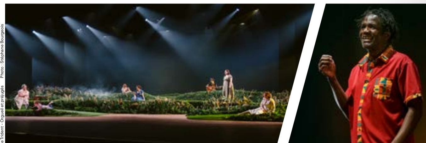
Le Trident - Orqueil et préjugés