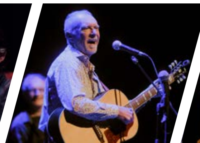
Zachary Richard