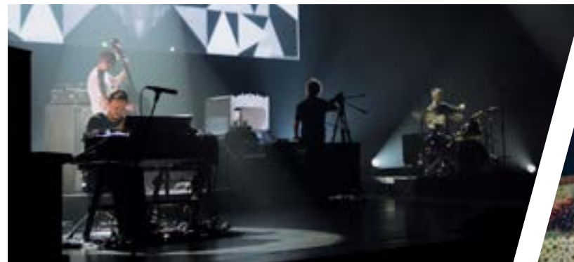
The Cinematic Orchestra

La Société du Grand Théâtre de Québec est soucieuse d'assurer une meilleure représentation de la diversité culturelle et pose des gestes concrets en ce sens. Ainsi, le Grand Théâtre se montre sensible à la reconnaissance des communautés culturelles dans la programmation de ses spectacles.