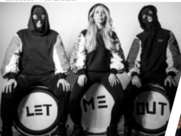
Balaklava Blues