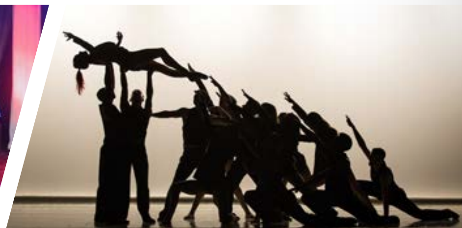
Dance Mé-Musique de Leonard Cohen