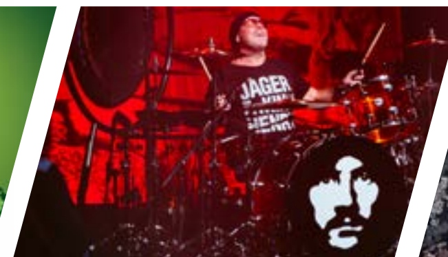
Jason Bonham