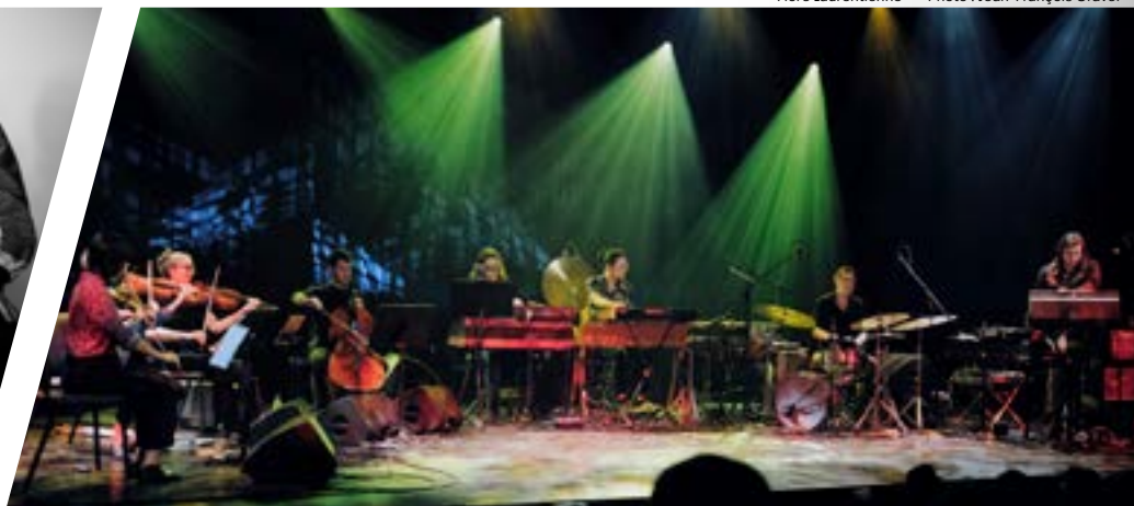
Flore Laurentienne