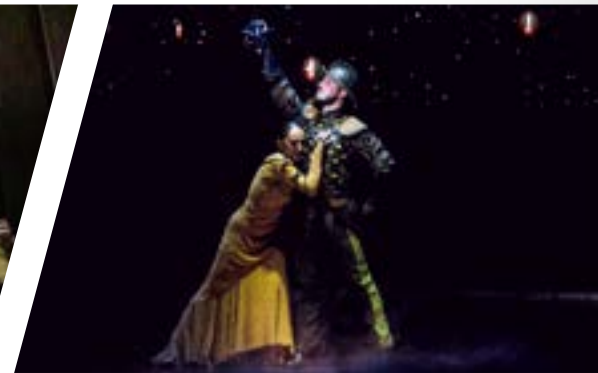
Don Juan Photo : Jean-François Gravel