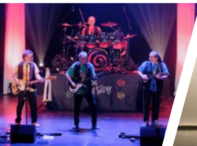
Les Petite Tounes