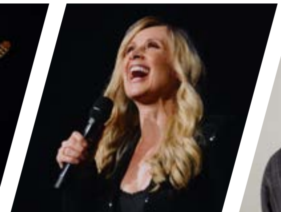
Lara Fabian