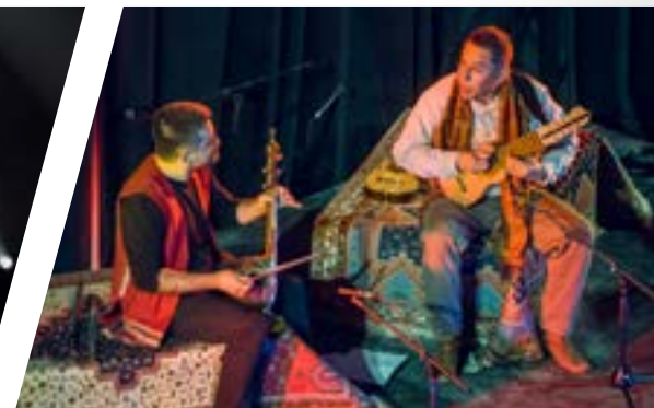
Duo Perse Inca