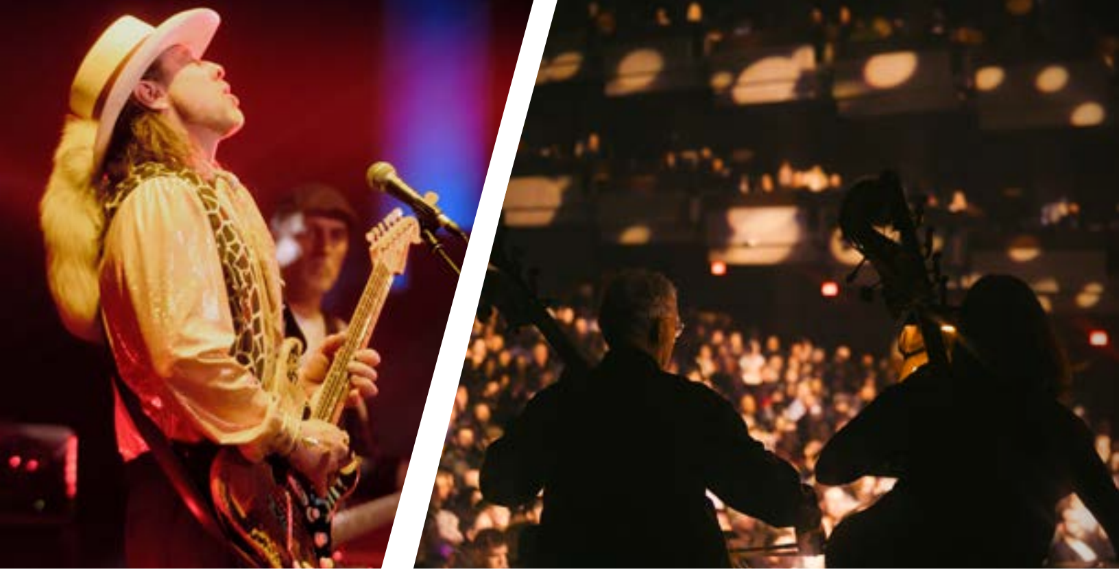
SRV Hommage à Stevie Ray Vaughan